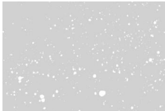
شکل شماره ۵: تست مثبت فلوئورسنت آنتی‌بادی در نمونه مغز

— تشخیص آنتی‌ژن ویروس به‌روش FAT (تست فلوئورسنت آنتی‌بادی) در بافت مغز تهیه‌شده پس از مرگ؛