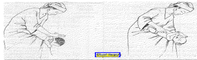
ضربه زدن به پشت